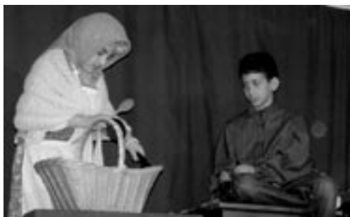
Das Schneiderlein kauft Mus