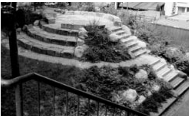
Das neue Außengelände, hier: Spielberg mit Wasserrinne und Sitzstufen.

Stadtteilentwicklung wurde unter großer Beteiligung der Eltern und Kinder das Außengelände der Kita neu geplant und gestaltet, so dass sie heute drinnen und draußen ein wunderbares Raumangebot nutzen können. sat