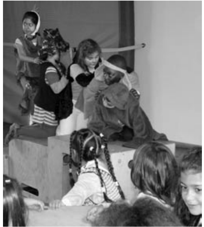
Gleich werden die Tiere die Räuber erschrecken...

Dann begann die Aufführung. Das Märchen wurde so einfühlsam vorgetragen, dass jedes Kind seinen Einsatz fand und seine Rolle richtig ausleben konnte. Die Kinder waren in Höchstspannung. Am Ende waren alle erschöpft und sehr stolz. Auch die Eltern und Lehrerinnen! Doch noch nicht genug: Die Künstler bekamen noch ein le-