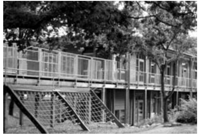
Die „neue“ Kita am Sommerweg mit dem freundlichen Holzhaus und dem Kletter-Spiel-Steg

Mit dem Umzug in das neue Gebäude ändert die Kita auch ihr Konzept: Die Kin-