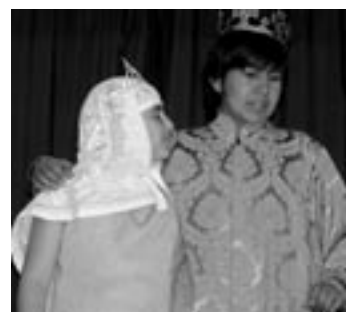
König mit Prinzessin