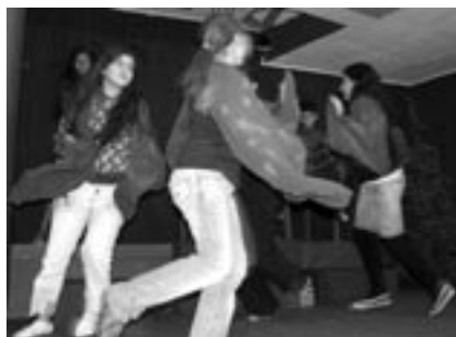
Tanz der Fliegen