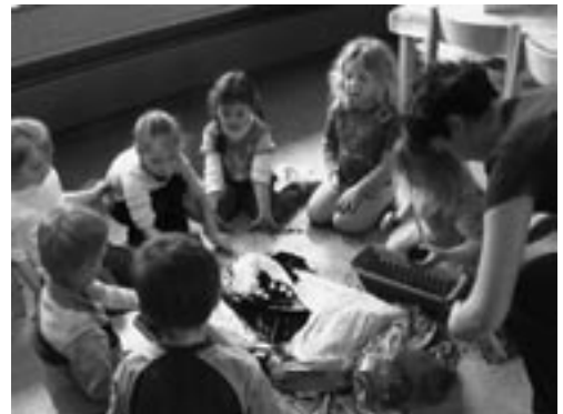
Gemeinsam Natur erkunden beim Pflanzen

rung für die Migrantenkinder. Daneben stehen viele andere wichtige und schöne Dinge auf dem Wochenplan, wie Ausflüge und den Stadtteil erkunden, Forschen