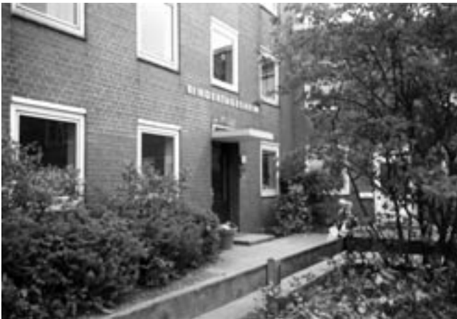
Das Wohnhaus am Lüdersring 5, in dem die Kita viele Jahre in drei Wohnungen untergebracht war.

Am 31. August 1998 zogen die 117 Kinder der Kita am Lüdersring in ihr neues Gebäude am Sommerweg ein. Am 29. August feiert daher die Kita Sommerweg von 14.00 – 19.00 Uhr nicht nur ihr traditionelles Sommerfest, sondern auch ihr zehnjähriges Jubiläum.