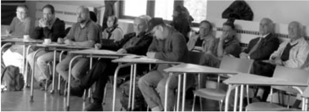
Regionalausschuss mit Gästen am 17. Juni 2008

Unter großer Anteilnahme Luruper Bürger/innen, Einrichtungen und Initiativen tagte am 17. Juni der Regionalausschuss II der Altonaer Bezirksversammlung im Stadtteilhaus Lurup.