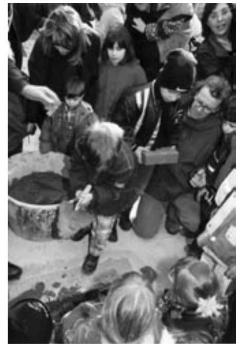
Grundsteinlegung für die Kita Sommerweg im März 1998