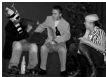
Piraten haben den Schatz geraubt

Eine eigenwillige Interpretation des „Tapferen Schneiderlein“ führte der Theaterkurs der Schule Luruper Hauptstraße am 19. Juni in der Stadtteilbühne am Eckhoffplatz vor großem Publikum auf: Nachdem der Schneider sieben Fliegen auf einen Streich erschlagen hat, stellt er sich Aufgaben eigener Art: „Warum ist mein Volk so dumm?“, will der König wissen. Das Schneiderlein findet die Antwort am Beispiel einer inhaltsleeren Fernsehshow. Außerdem jagt das Schneiderlein einer Piratenbande den königlichen Schatz ab und findet heraus, warum die Frauen im Land so traurig sind: Ein Heiratsschwindler hat ihnen das Herz gebrochen.