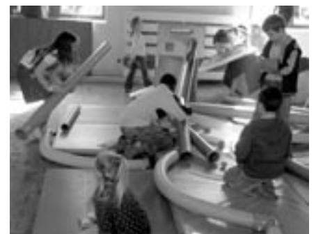
Spaß mit der Bewegungsbaustelle

Lese-Kultur-Café als Lernort außerhalb der Schule für ihre Schüler/innen hat. Sabine Tengeler vom Büchereiteam