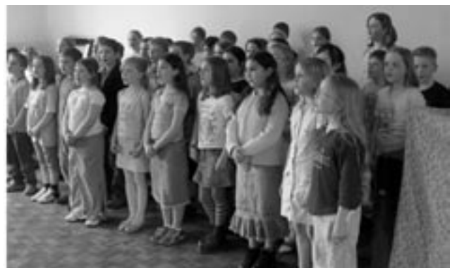
Der Chor der Fridtjof-Nansen-Schule Swattenweg eröffnete das Fest am 3. Mai mit Frühlingsliedern.

Die Schreibwerkstatt „Wundertinte“ bereicherte das Fest am 3.5. mit einer Lesungeigener Texte (I.).