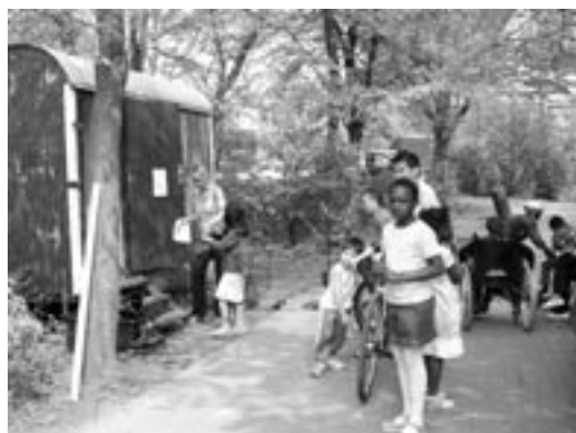
Spielgeräteausleihe an der Sporthütte

sonnigen Frühlingstag auf dem Spielplatz eingefunden, um bei Grillwürstchen und Getränken die vielfältigen Spielangebote und Ausleihe gegen Pfand zu nutzen.