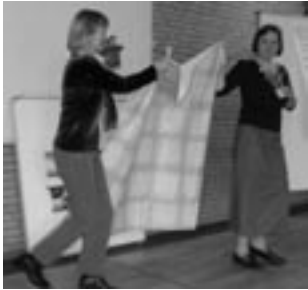
Einweihung des Infobretts zur Gesundheitsförderung

Am 19. April weihte die Ganztagskonferenz der Schule Langbargheide feierlich das White-Board zur Gesundheitsförderung ein, das aus dem Verfügungsfonds des Luruper Forums finanziert wurde. Diese Tafel hängt zur Zeit im Lehrerzimmer. Die Kolleg/innen informieren einander darauf mit kleinen Ausstellungen über gesundheitsfördernde Unterrichtspraxis an ihrer Schule. Auf einem Bord darunter finden sie Bücher und weiteres Informationsmaterial zum Thema als Anregung für den eigenen Unterricht.