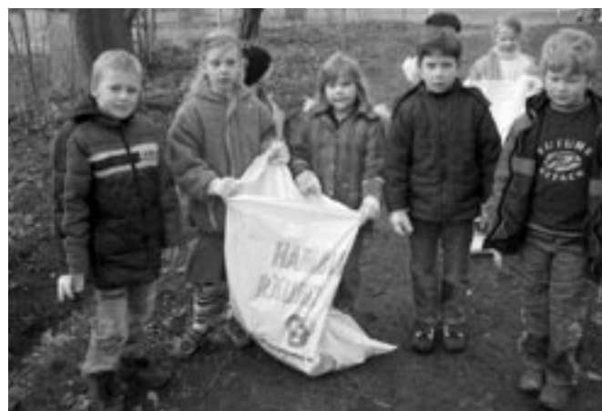
Die fleißigen Müllsammler/innen aus der 2. Klasse der Schule am Altonaer Volkspark