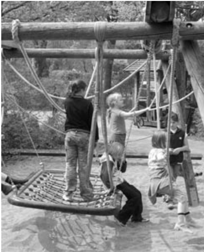
Spaß in der Seilkletterlandschaft auf dem Ecki

Am 6. April feierte die Sporthütte auf dem Spielplatz „Ecki“ am Ammernweg Wiedereröffnung. Dabei verabschiedete sich Kai Hopkins, der die Sporthütte im Auftrag des Schnittstellenprojekts REALÜ betreut hatte und übergab den Spielgeräteverleih an das Team vom JUCA Lurup. Der Geräteverleih in der Sporthütte ist jetzt wieder jeden Dienstag und Donnerstag von 14.30 bis 16.30 Uhr geöffnet.