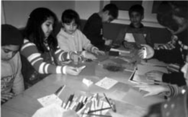
Bis zu 22 Kinder spielten, bastelten und backten zusammen beim Sporthütte-Wintertreff im Nachbarschaftstreff

Das Sporthütten-Team verabschiedet sich nach vier Jahren Spiel und Sport mit einem Teilnehmerrekord beim „Sporthütte Wintertreff“ im Mieter- und Nachbarschaftstreff (Lüdersring 2a) und übergibt das Ruder an die Kolleg/innen des JUCA Lurup.