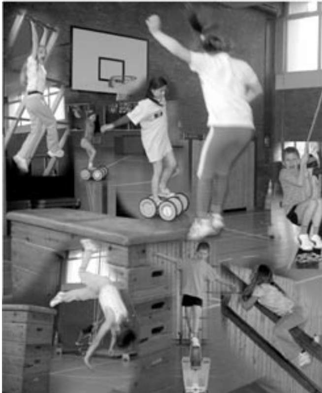
Eigene Fähigkeiten entdecken und präsentieren beim selbstbestimmten Bewegen mit Geräten

Als Psychomotorik bezeichnet man das Zusammenspiel von psychisch-seelisch-emotionalem Erleben und Be-