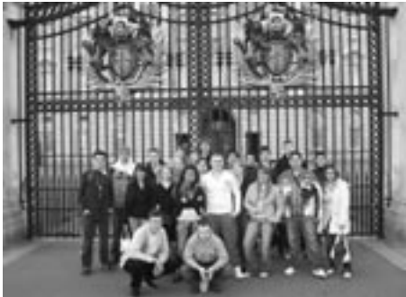
Klassenfoto vor dem Buckingham Palace

Die Abschlussklasse R10 der Schule Langbargheide fuhr am 03.04.2006 auf Klassenreise nach London.