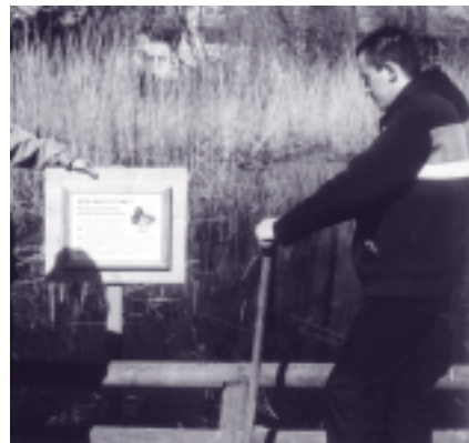
Die Bachpatengruppe Russia stellt das Enten-Bitte-Nicht-Füttern-Schild am Ententeich auf.

Joachim Wöpke, Bachpate