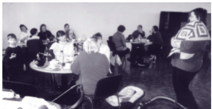
Erst frühstücken und klönen, dann etwas für die Gesundheit tun.