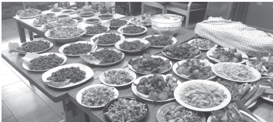
Das leckere Festbuffet