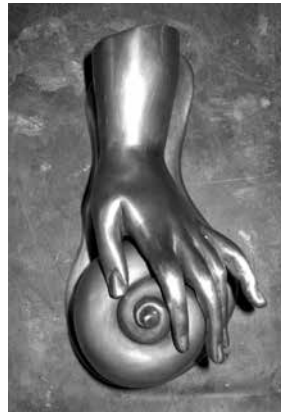
Ein ganz besonderer Beschlag

„Früher haben Architekten sich auch mit Details wie Türgestaltung und dazu passenden Klinken und Beschläge befasst und individuelle Metallteile fertigen lassen“, erklärt Harald Gorth. In diesem Sinne arbeiten die HMB auch heute mit ihren Auftraggebern zusammen, entwerfen, formen und bauen anspruchsvolle, ansprechende und individuell auf die Kundinnen und ihre