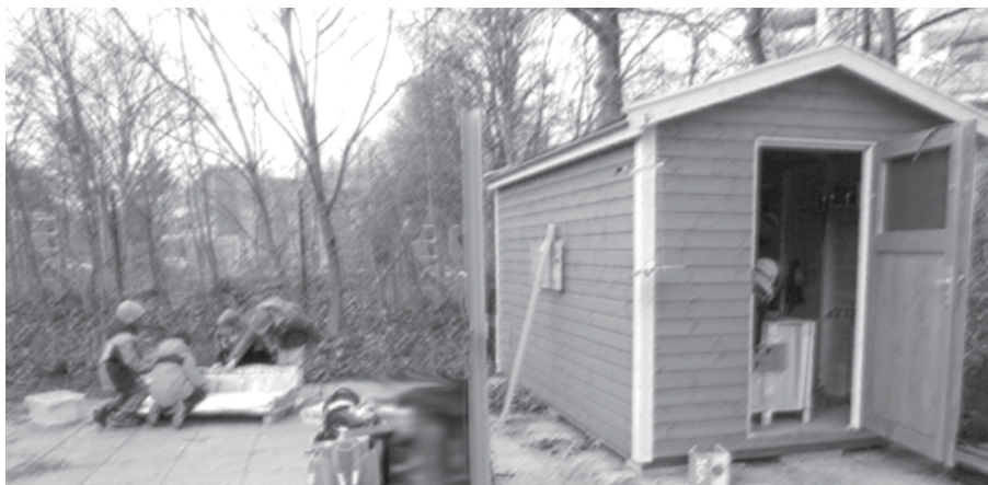
Das JUCA-Garten lädt zum Mitarbeiten ein

Kartenvorbestellung unter 0152 29087733 (Adline Hartig)