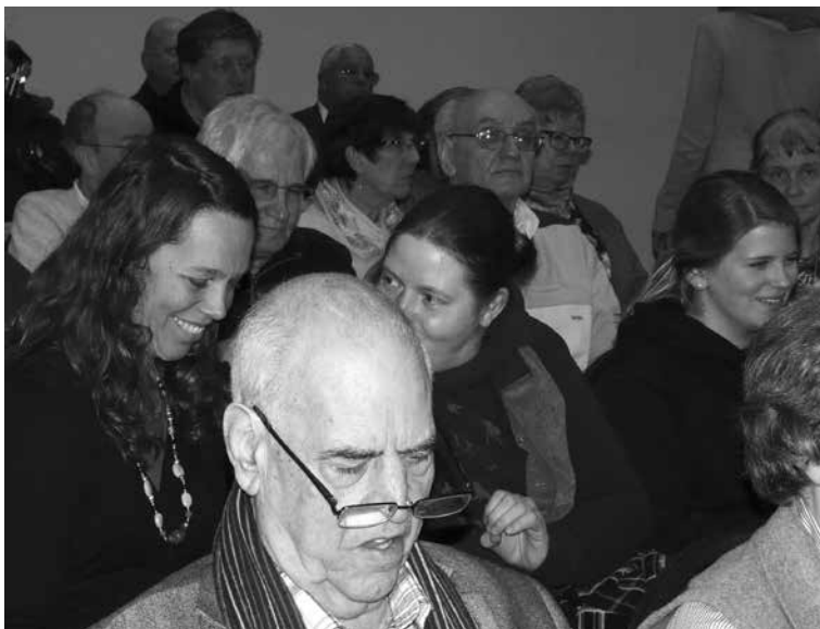
Inklusion auf dem Luruper Forum am 30.3.

Wir versuchen, sie so zu unterstützen, dass sie mit Konflikten besser zurecht kommen. Nach anderthalb Jahren gehen alle wieder komplett zurück in die Stammklasse mit allerdings unterschiedlichem Erfolg.“