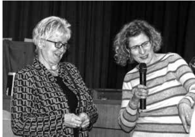
oben: Der Schulchor verabschiedet sich mitte: Der Chor der Schulgemeinschaft unten: Die Ganztagsbetreuerin überreicht ein Geschenk