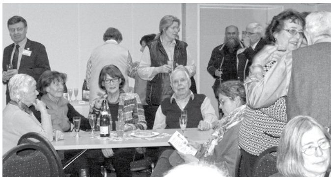
Lebhafter Austausch und Begegnung beim Neujahrsempfang des Luruper Bürgervereins

Am 6.1. lud der Luruper Bürgerverein zum Start ins neue Jahr ins Stadtteilhaus Lurup ein. Vertreter/innen von Politik, aus Luruper Vereinen und Institutionen und viele Mitglieder des Bürgervereins ließen das vergan-