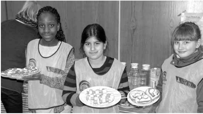
Schülerinnen der Grundschule Langbargeide haben leckeres, gesundes Essen für den Runden Tisch zubereitet.

gendalter alles tun, um ein hohes Niveau zu erreichen. Dann kann man gut älter werden. Je höher das Niveau, um so länger bleiben wir so fit, dass wir selbständig leben können.