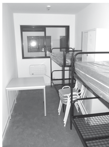
oben: Diese Sanitäranlagen müssen sich jeweils etwa 18 Bewohner/innen teilen. Das Duschwasser läuft unter den Türen heraus. An den Waschrinnen gibt es zur Zeit nur kaltes Wasser. rechts: Die Wohnräume sind aktuell mit jeweils zwei Betten ausgestattet.