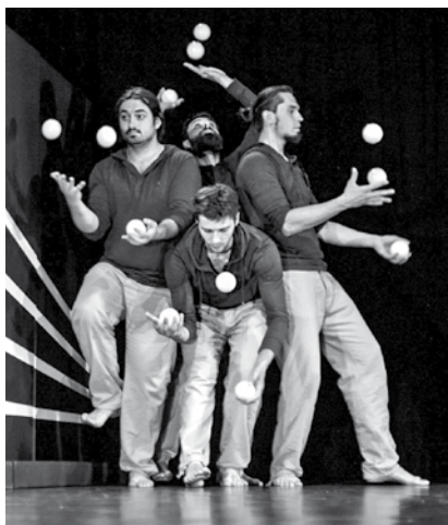
Mit dabei auf der LurUPina: Kolektyw ŁL aus Polen

Der Festivaltag am Samstag, 1.9. , beginnt mit der aufregenden Show von Collective A aus Berlin „Im Nebel“ auf der Spitze des „Berges“. Nahtlos folgt eine Aufführung der nächsten Aufführung: ganz unterschiedlich, mit außergewöhnlichen Kunststücken in vollem Risiko!