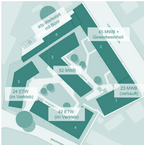
Planung der Bonava für das Bauvorhaben „Luruper Höfe“ zwischen Luruper Hauptstraße 79 und Böttcherkamp.

• Insgesamt wurde 2017 der Bau von 92 Wohneinheiten genehmigt, davon ein Vorhaben mit mehr als 20 Wohneinheiten. 2018 wurde bis jetzt der Bau von 46 Wohneinheiten genehmigt. Es gibt laufende Anträge für 253 Wohneinheiten, davon zwei Vorhaben mit mehr als 20 Wohneinheiten.