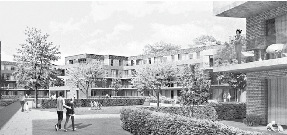
Neubauprojekt „Wohnen am Volkspark“. Die Genossenschaftswohnungen an der Elbgaustraße/Vorhornweg sind bereits vergeben...