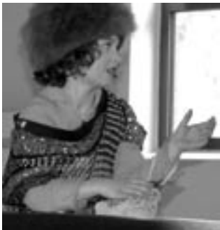
Die alte Frau bitte um Brot.

dy lasen ihnen das Märchen von der „Zitronenprinzessin“ vor. Inspiriert von der Geschichte gestalteten die Kinder mit den Materialien der Bewegungsbaustelle Berglandschaften und Schlösser. Gleichzeitig verwandelten sich die Kinder mit Hilfe der Mitarbeiterinnen der Stadtteilbühne Lurup nach und nach in verschiedene Figuren des Märchens.