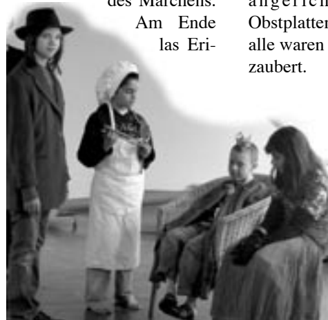
Der Koch bringt Aschenmichel in Schwierigkeiten.

dy lasen ihnen das Märchen von der „Zitronenprinzessin“ vor. Inspiriert von der Geschichte gestalteten die Kinder mit den Materialien der Bewegungsbaustelle Berglandschaften und Schlösser. Gleichzeitig verwandelten sich die Kinder mit Hilfe der Mitarbeiterinnen der Stadtteilbühne Lurup nach und nach in verschiedene Figuren des Märchens.