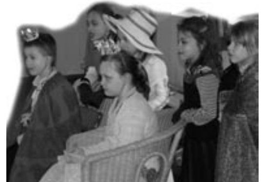
Die Hofgesellschaft erwartet die Zitronenprinzessin

Wir gemeinsam für Familien e.V. lädt ein: