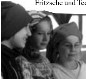
Die hilfreichen Zwerge